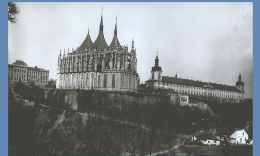
1 Snímek chrámu sv. Barbory a Jezuitské koleje z počátku 20. století. V domečku pod chrámem byla hospoda „Na kopečku“.