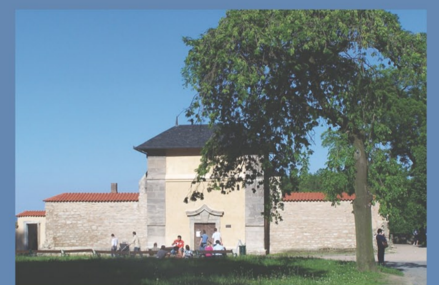
4 Fotografie kaple Božího Těla z druhé strany