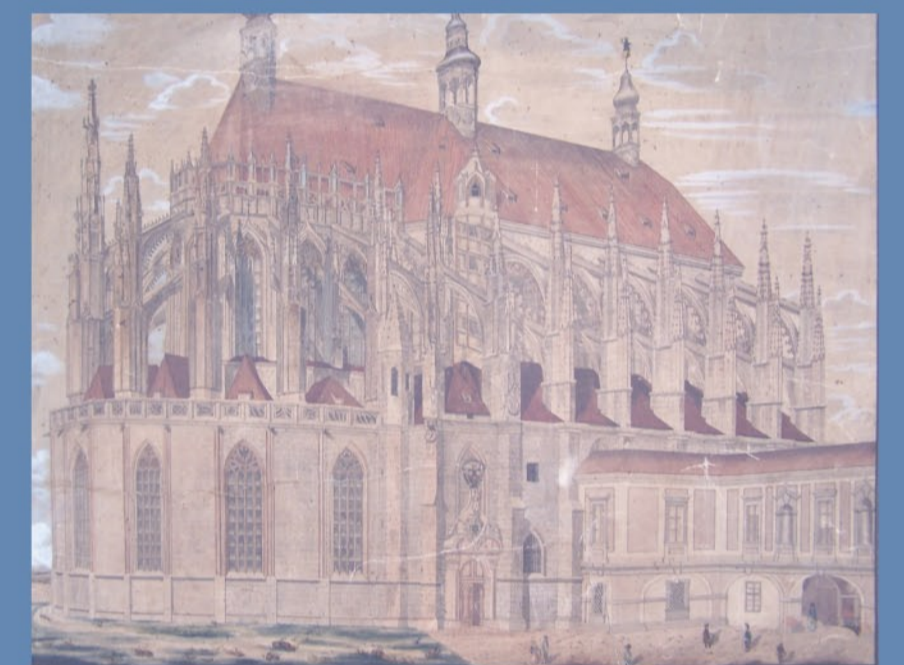
2 Kolorovaná kresba z roku 1843, zachycující spojovací chodbu